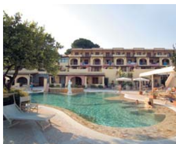
Hotel Tritone / Lipari (ME)