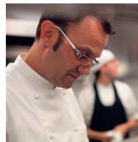
Gianpaolo Raschi Ristorante Guido Miramare di Rimini