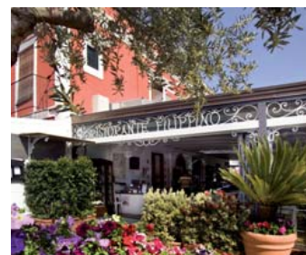
Ristorante Filippino/ Lipari (ME)